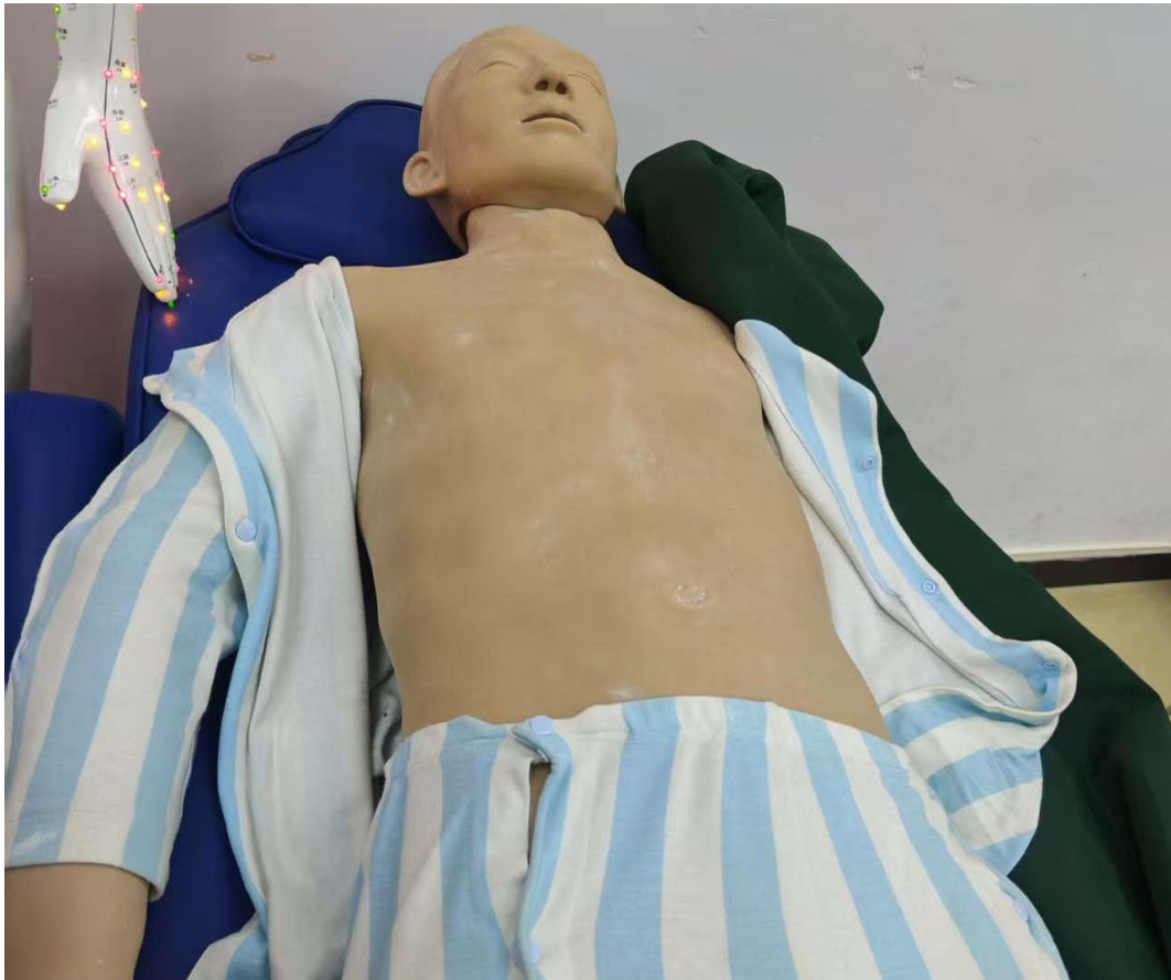
图 1：全身针灸仿真训练系统