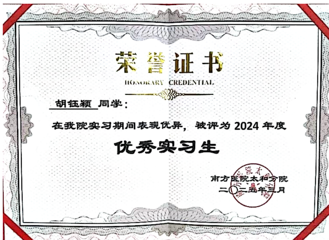
图10：优秀实习生证书-1