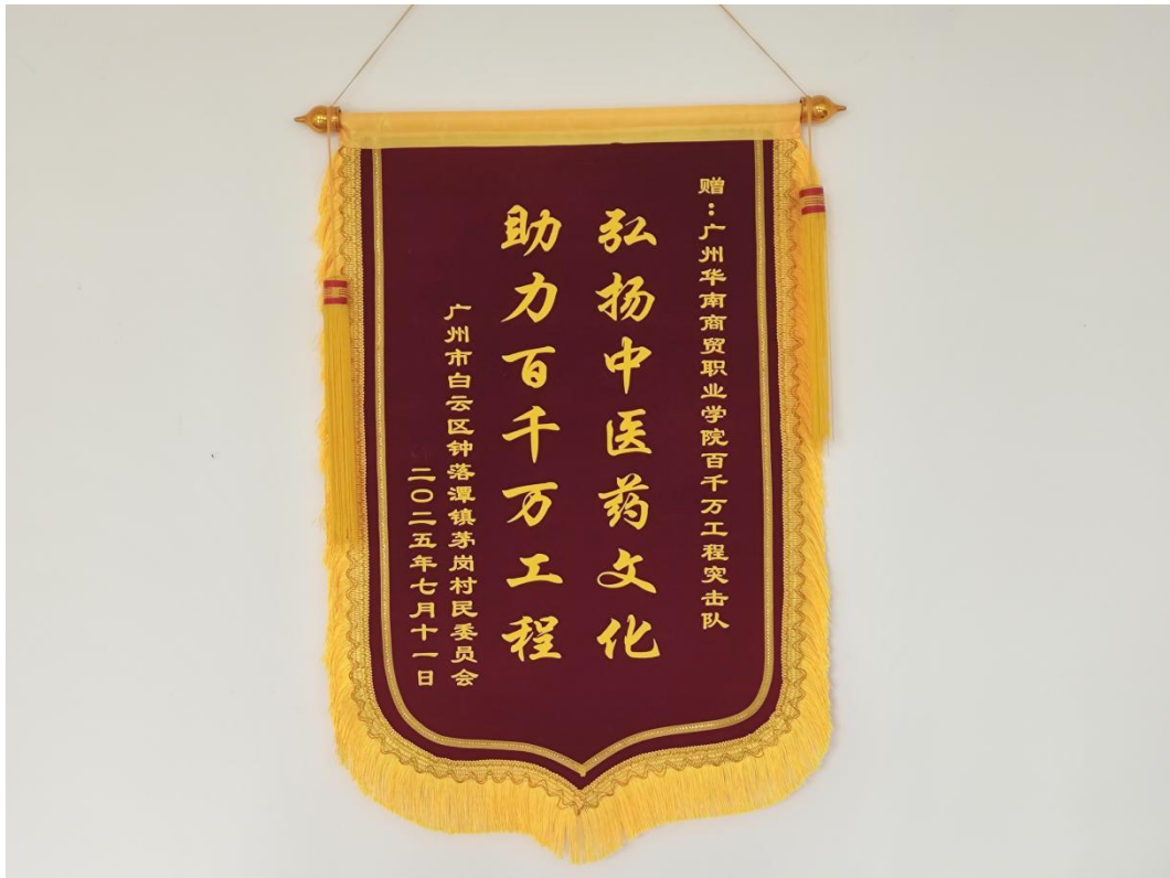
图5：茅岗村民委员会赠百千万工程突击队锦旗