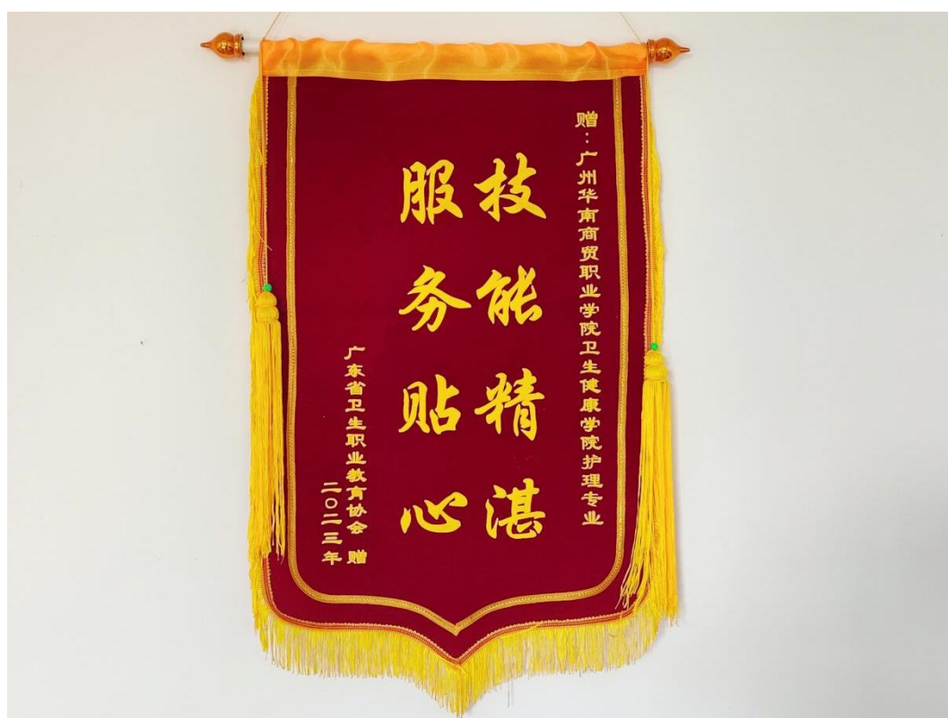
图8：广东省卫生职业教育协会赠锦旗