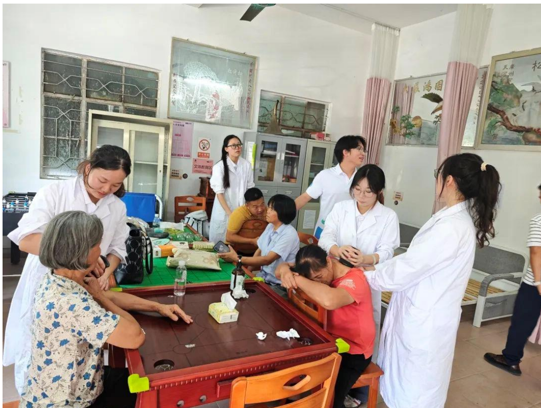
图3：“愈心于行”突击队赴广州市白云区茅岗村三下乡实践活动