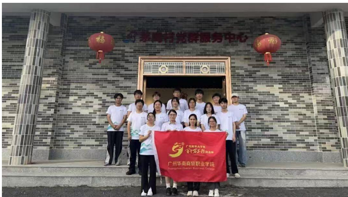
图4：健康服务突击队赴茅岗村三下乡实践活动