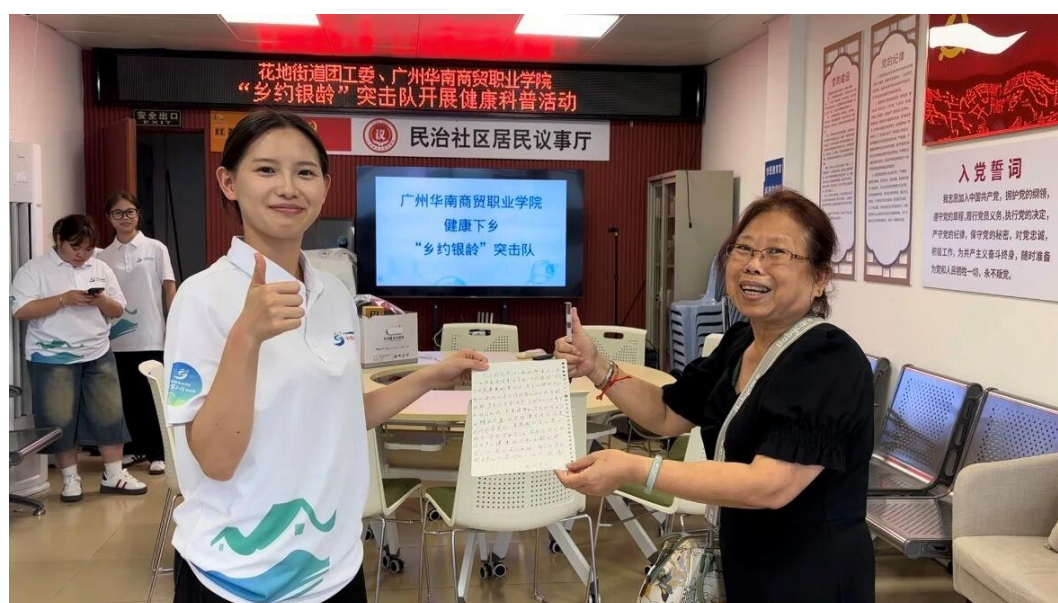
图2：“乡约银龄”突击队表扬信