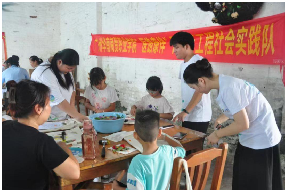
图7：“医路康伴”突击队赴梅田村开展三下乡实践活动