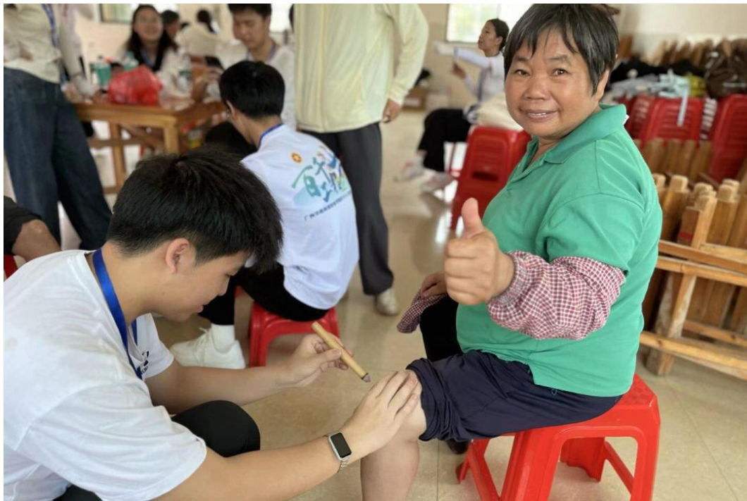
图6：“乡村健康”青春医路队赴清远市佛冈县汤塘镇暖坑村三下乡实践活动