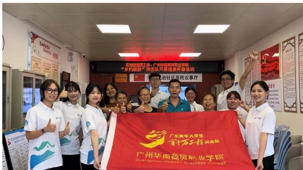
图1：“乡约银龄”突击队赴广州市荔湾区花地街道三下乡实践活动